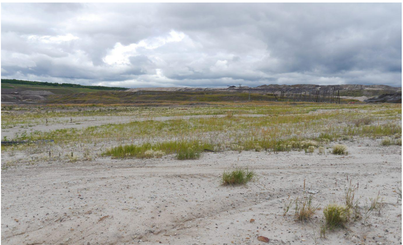
Optimální biotop lindušky úhorní v hnědouhelném lomu Šverma.