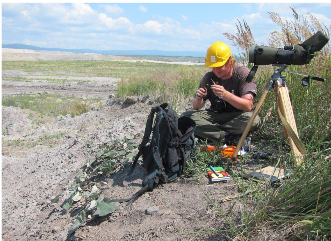
Ukázka kroužkování odchycené lindušky úhorní přímo v teritoriu. Lom Šverma.