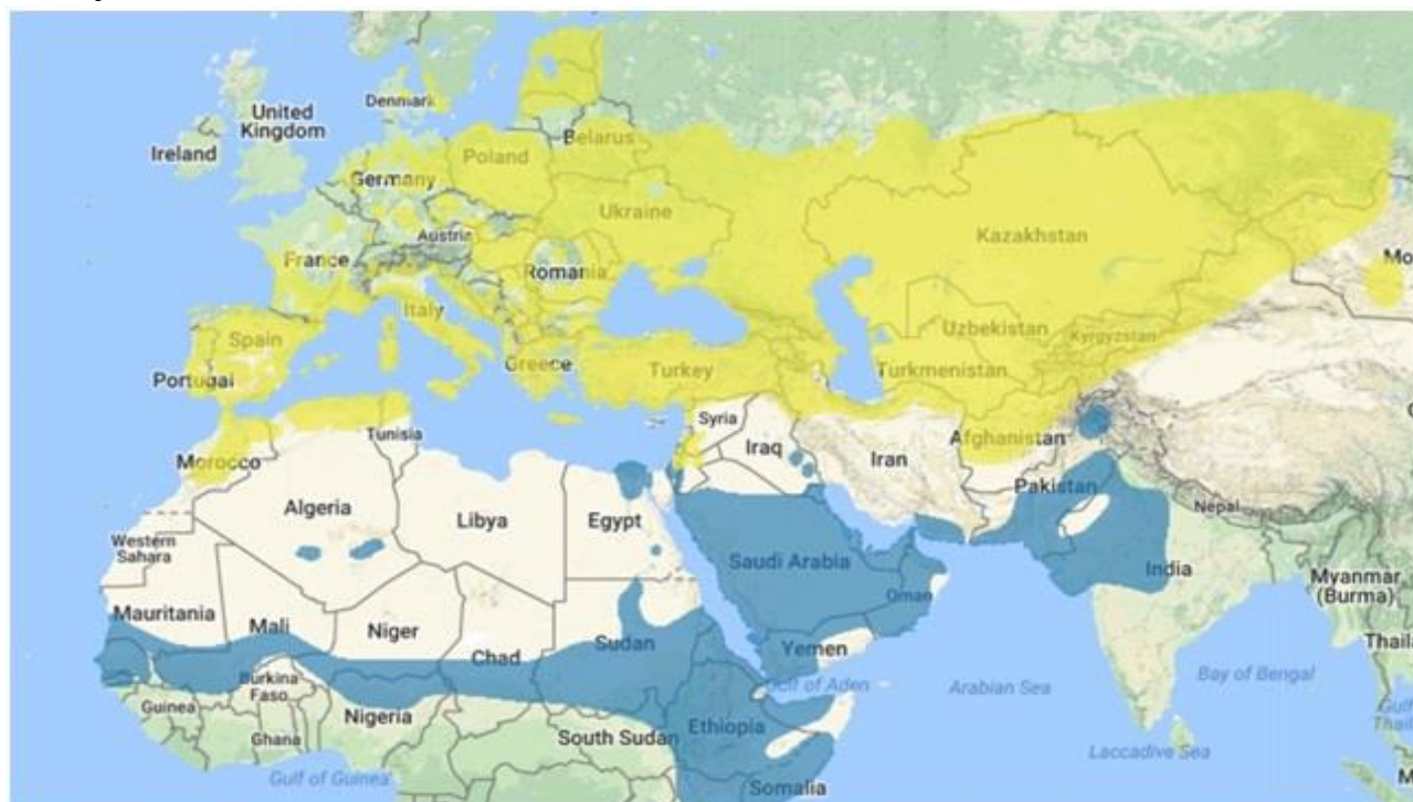
Mapa areálu rozšíření lindušky úhorní. Žluté oblasti – areál hnízdního rozšíření, modré oblasti – zimoviště.