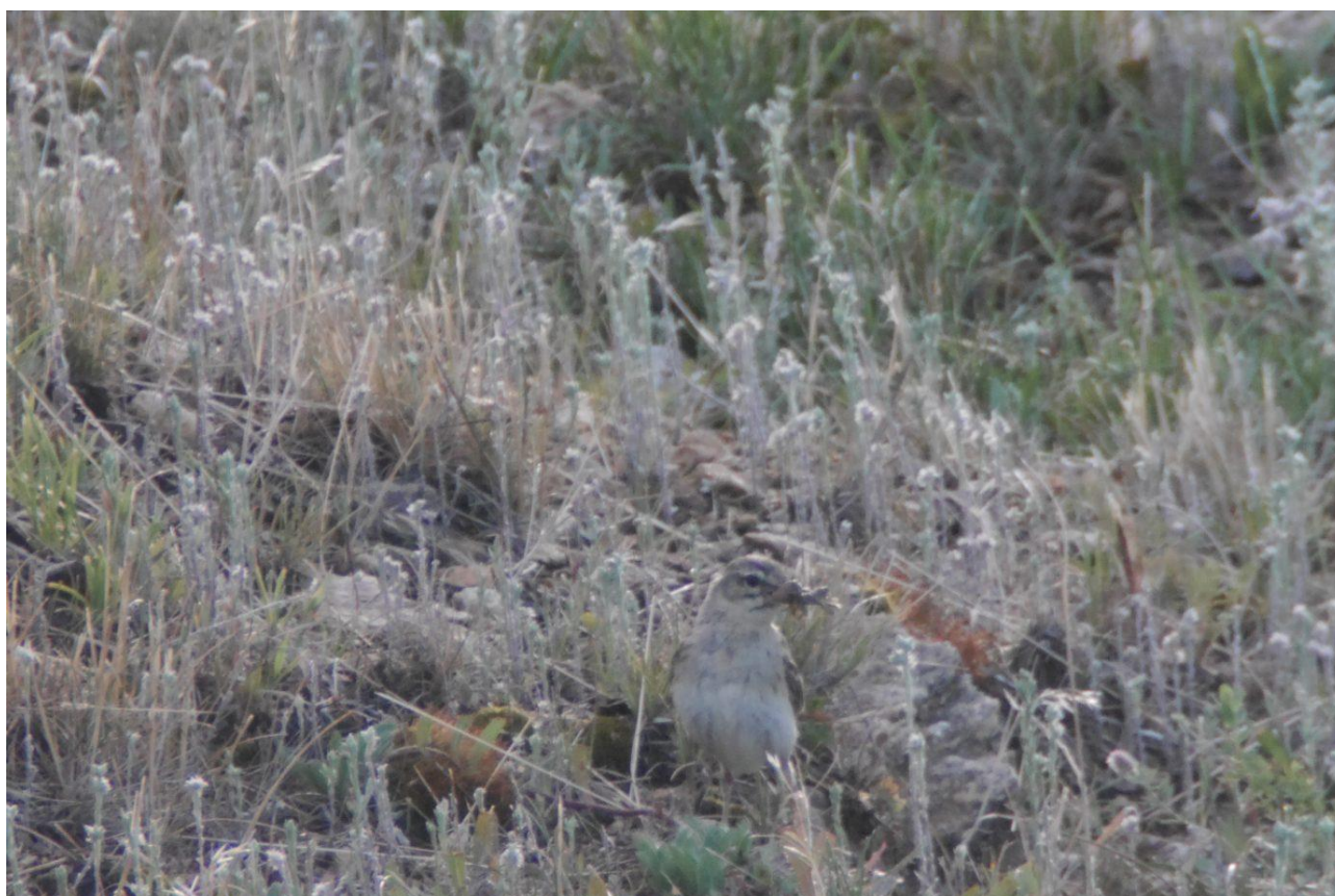
Samice lindušek úhorních tráví většinu života na zemi a jsou téměř „neviditelné“. Lom ČSA.