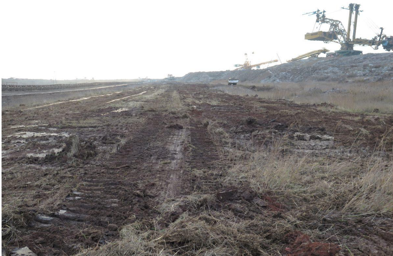
Málo úživné plochy stačí strnout povrchově. Na fotce jsou vidět nerovnosti i ostrůvky vegetace po zásahu. Lom Hrabák.