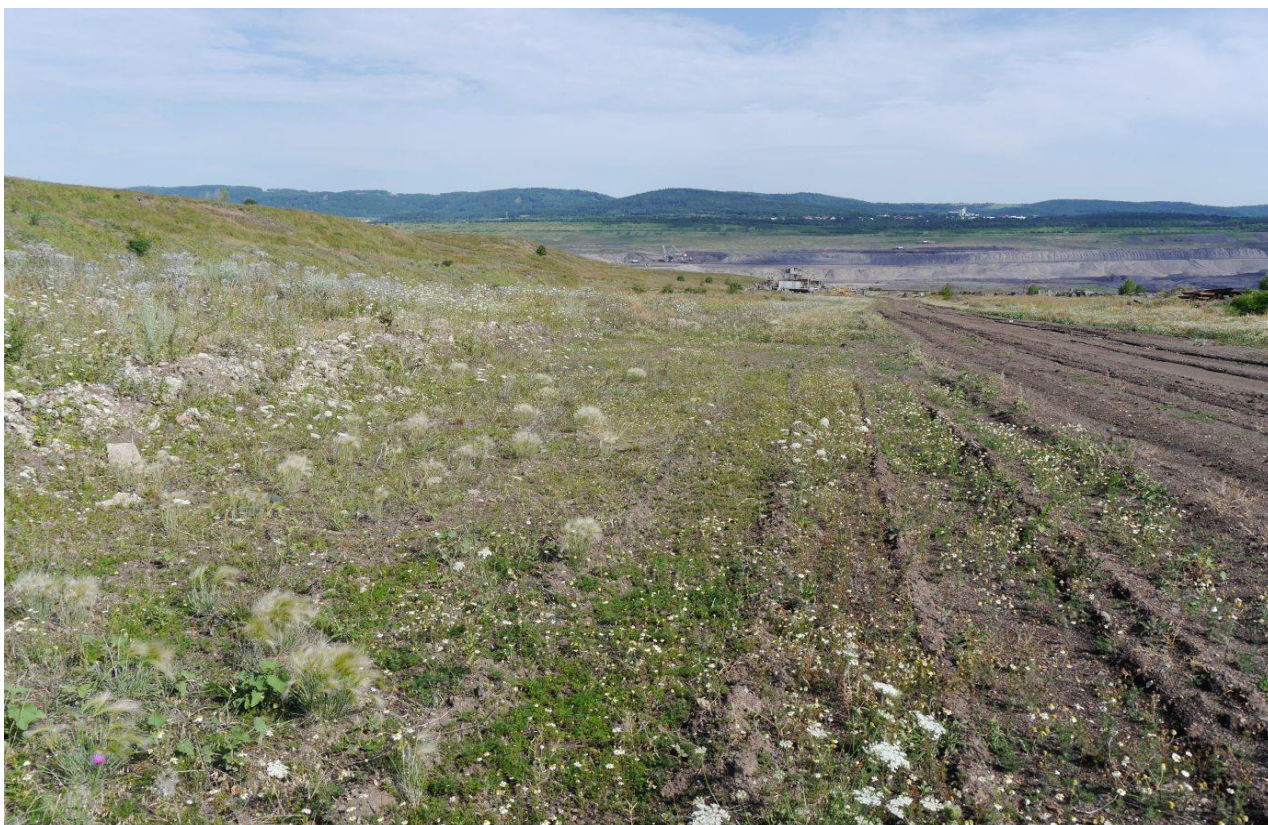
Pouhý pojezd pásové techniky na řídkce zarostlých plochách či podél cest výrazně zvyšuje atraktivitu území pro lindušku úhorní. Výsypka lomu Šverma.