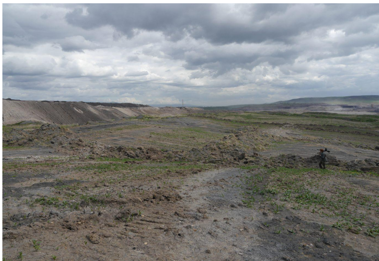
Rozsáhlé území po managementovém zásahu s ponechanými hromadami a dalšími terénními nerovnostmi. Výsypka lomu Šverma.