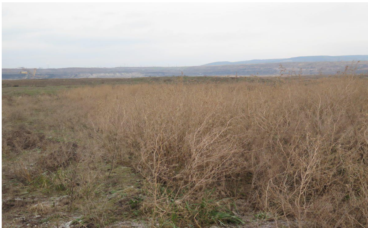
Ukázka ploch velice bohatých na živiny, které nejsou vhodné pro realizaci managementu. Na fotce je rozsáhlý porost merlíku. Lom Hrabák.