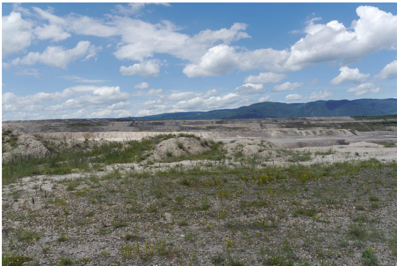
Optimální prostředí s nízkou pokryvností a celkově nízkou vegetací v „srdci“ hnědouhelného lomu Šverma.