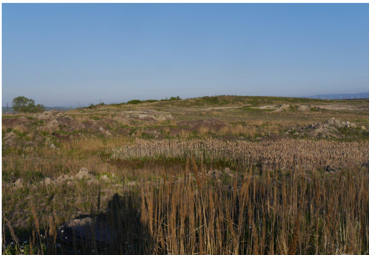
Ukázka velmi členité, linduškou úhorní hojně obsazené plochy. Slatinická výsypka.

Nákladnost realizovaného opatření se odvíjí i od členitosti terénu. Obecně platí, že realizace opatření na rovné ploše je výrazně jednodušší a levnější než na ploše členité (prudké svahy, členitý terén po nasypání zakladačem). Nicméně z pohledu lindušky úhorní i z pohledu biodiverzity jsou vhodnější plochy členité. Respektive vlastní zásah může být proveden na rovné ploše, celkové vyčleněné území ale může zahrnovat i další, výrazně členitá území. Například svahy v okolí plochy, hřebínky nasypaného materiálu, hromady, louže a tůně různých velikostí atd. Není nutné ani žádoucí vytvořit velkou rovnou plochu. Naopak nepravidelnosti a členitosti v daném území dávají vzniknout pestřejší ploše. V některých místech se může déle držet voda a mohou zde prosperovat jiné druhy rostlin než na sušších místech atd. Díky tomu vznikají kvalitní teritoria s vhodnými potravními ploškami, místy s bohatší vegetací (která je vhodná pro hnízdění) i zcela holé či velmi řídké zarostlé plochy poskytující vhodné prostředí pro řadu druhů bezobratlých, jež jsou potenciální kořisti lindušek. Řídké zarostlé plochy by měly tvořit minimálně 50 % plochy území.