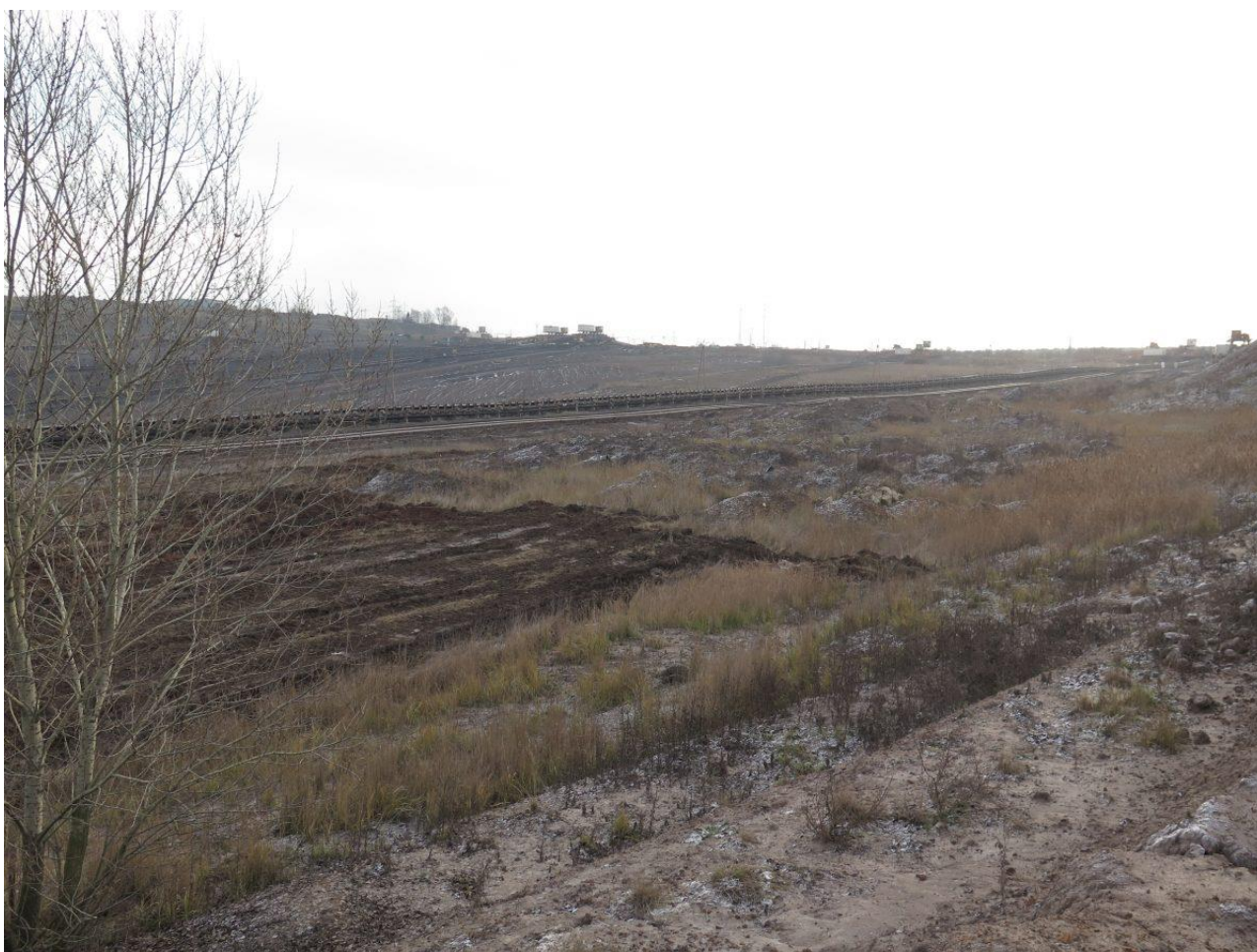
Mozaika ploch s odstraněnou vegetací, neupravenými svahy a ponechanými mírně zarostlými hromadami – ukázka efektivního a finančně úsporného managementu. Lom Hrabák.

Vytipované plochy k zásahu není žádoucí planýrovat plošně. Ideální je na dané ploše nechat 10–40 % bez zásahu. K tomu je vhodné vybírat místa se zvýšenou biodiverzitou (mokřiny, menší rákosiny, soliterní keře), výškově členitá místa (hromady, prudké svahy) či obtížně upravitelné plochy (trvale zamokřené sníženiny atp.), kde by opatření byla navíc více nákladná. Pokud na ploše zůstanou zachovány ostrůvky hustší vegetace, ptáci je využijí pro hnízdění, sběr potravy atd.