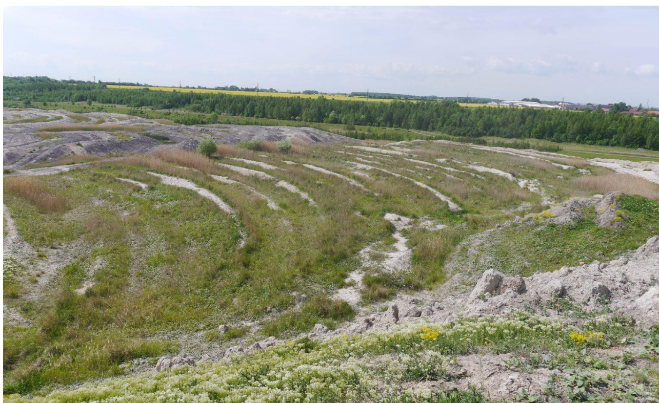
Území vhodné pro managementové úpravy – málo úživná plocha zarostlá především třtinou. Při realizaci je žádoucí zachovat holé „hřebínky“ a podmáčené části zvyšující biodiverzitu. Výsypka lomu Šverma.