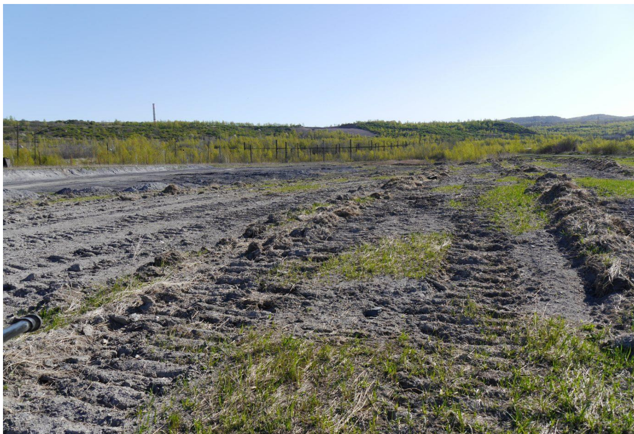
Vertikálně členitá plocha s mozaikou vegetace po managementovém zásahu. Lom Šverma.