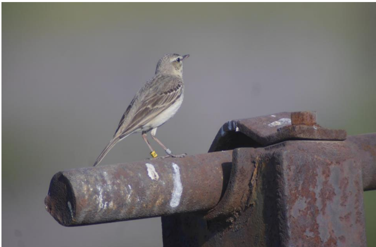
Značený samec lindušky úhorní na vyvýšeném místě, ze kterého často zpívá. Vyvýšená místa, ať již hromady, různé kolíky či kůly nebo konstrukce a technologie výrazně zvyšují atraktivitu území pro lindušky úhorní, samci na nich pravidelně hlídají a zpívají a monitoring je pak na takovýchto plochách výrazně jednodušší. Lom Šverma.