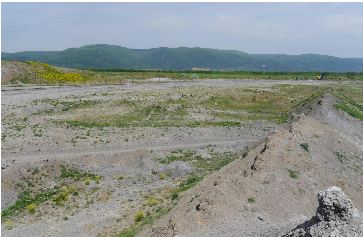
Velmi členitá, řídkce zarostlá plocha obsazená linduškou úhorní. Výsypka lomu Šverma.