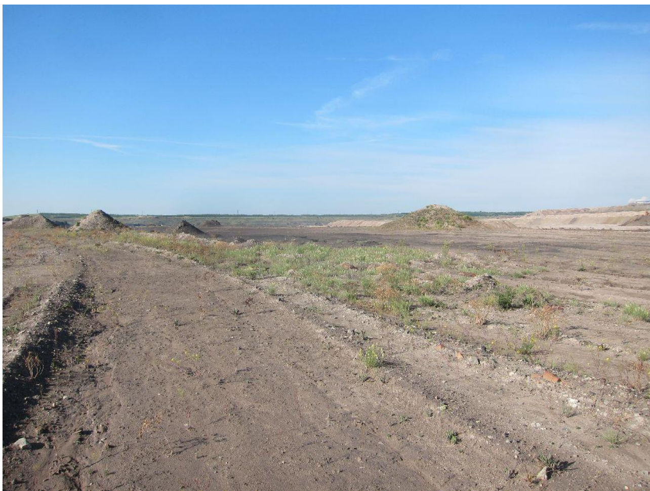
Hromady, valy, prohlubně či koleje zvyšují pestrost cílových ploch. Lom Šverma.

Nákladnost realizovaného opatření se odvíjí od členitosti terénu. Obecně platí, že realizace opatření na rovné ploše je výrazně jednodušší a levnější než na ploše členité. Nicméně z pohledu biodiverzity jsou vhodnější plochy členité. Respektive vlastní zásah může být proveden na rovné ploše, celkové vyčleněné území ale může zahrnovat i další, výrazně členitá území. Například svahy v okolí plochy, hřebínky nasypaného materiálu, hromady, louže a tůň různých velikostí atd. Není nutné ani žádoucí vytvořit velkou rovnou plochu. Naopak nepravidelnosti a členitosti v daném území dávají vzniknout pestřejší ploše. V některých místech se může déle držet voda a mohou zde prosperovat jiné druhy rostlin než na sušších místech atd. Díky tomu vznikají kvalitní teritoria s vhodnými potravními ploškami, místy s bohatší vegetací i zcela holé či velmi řídké zarostlé plochy. Řídké zarostlé a holé plochy by měly tvořit minimálně 50 % plochy území. Pro hnízdění je vždy nutná hromada kamení či jiné skalní dutiny. V těžebních prostorech lze využít i starou/nepoužívanou techniku či dopravní technologie (pražce, odložené pásové dopravníky atd.), ve kterých jsou vhodné dutiny (viz kapitola 3 „Vytváření vhodných hnízdní možností“).