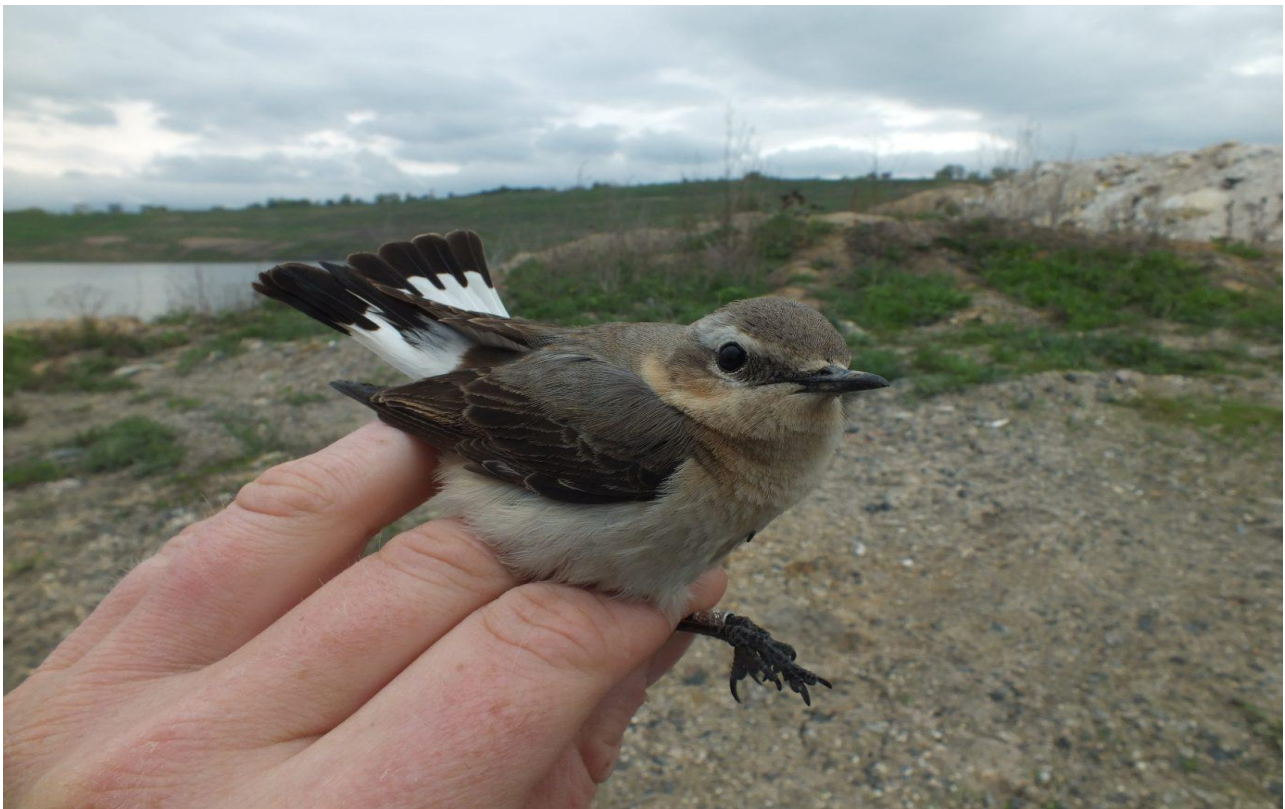
Bělořit šedý v typickém prostředí. Jezero Most.