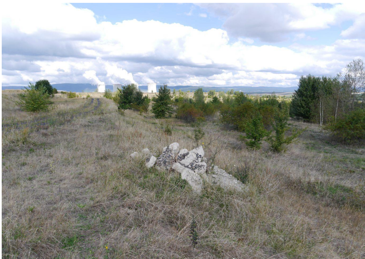
Hnízdo v hromadě nalámaného betonu na zrekultivovaném odkališti elektrárny Tušimice.