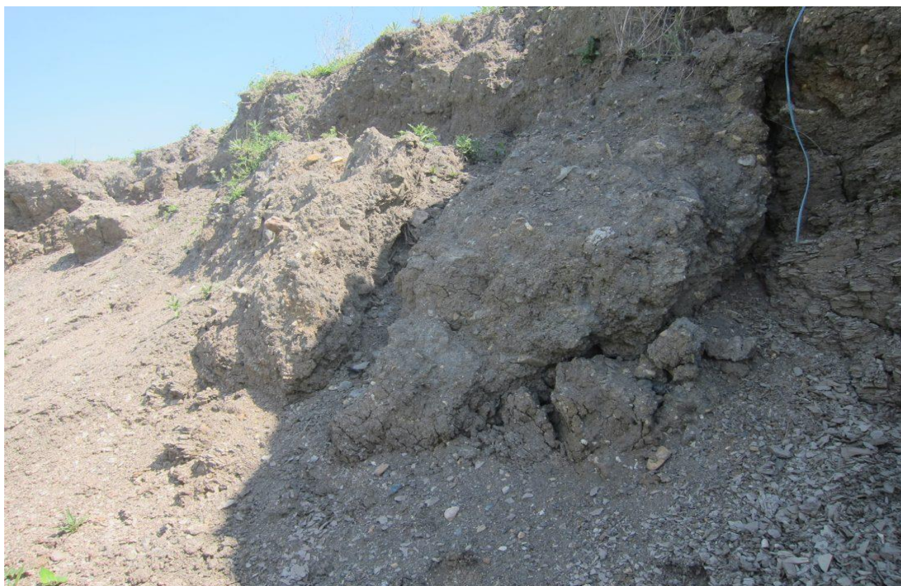
Nepříliš stabilní hnízdiště v puklinách erodujících jílovitých svahů (řezů lomu). Lom Šverma.