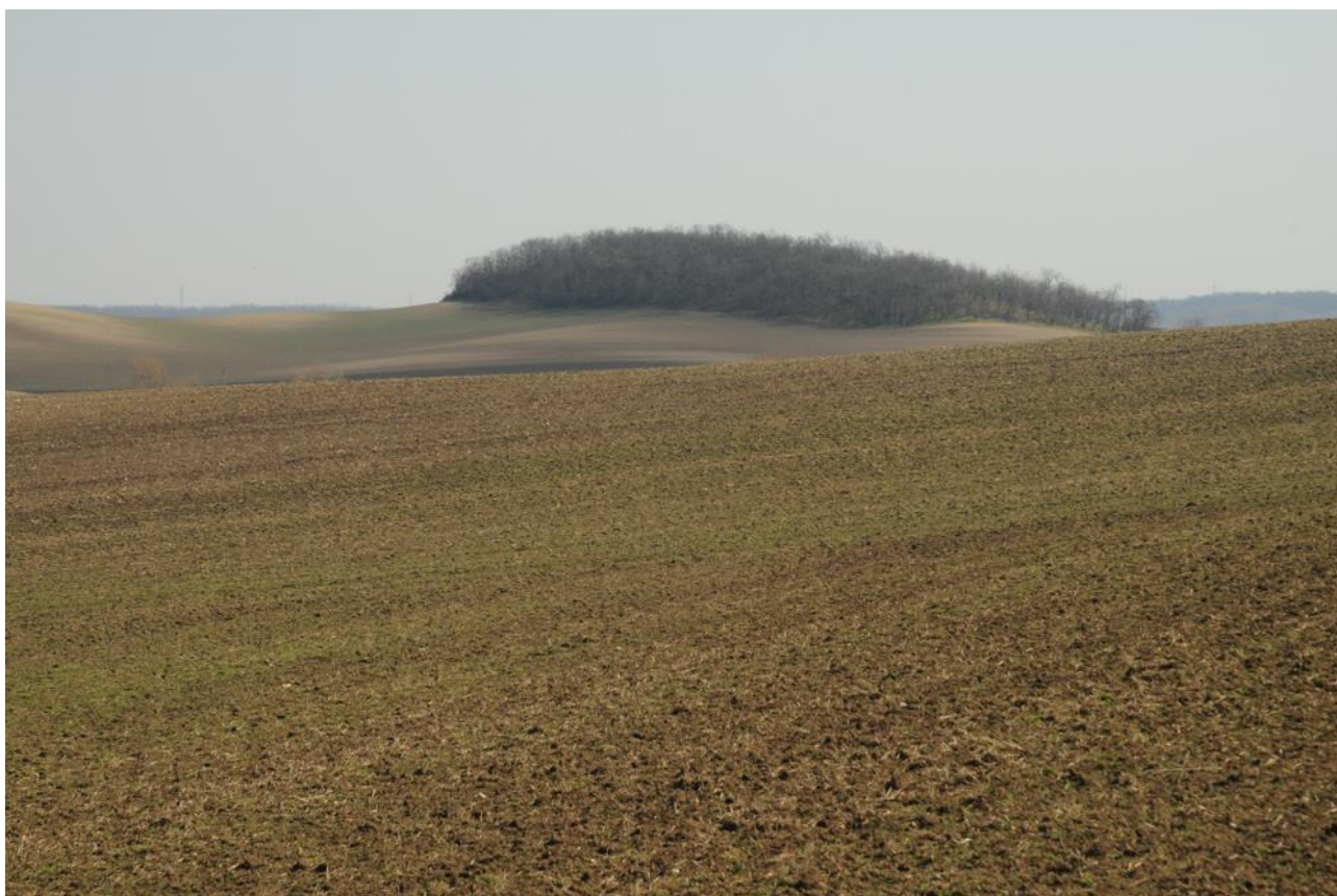
Intenzivně obhospodařovaná zemědělská krajina poskytuje životní prostředí pouze minimu těch nejprizpůsobivějších druhů. Brněnsko.

Vzhledem k charakteru těchto důvodů není pravděpodobné, že v naší zemědělské krajině dojde, při zachování stávajícího systému hospodaření, k takovým změnám, které by v následujících desetiletích umožnily návrat a dlouhodobé přežívání bělořitů šedých. V posledních letech ale došlo k částečnému obnovení pastvy na některých méně úživných pastvinách (Českého středohoří, obecně podhůří našich hor) a je možné, že tyto pastviny (především ty, jež budou nejbliže současné jádrové oblasti výskytu bělořitů) budou obsazeny jednotlivými páry. Pro jejich přežití bude ale klíčová silná zdrojová populace, která je v současné době pouze v aktivních lomech.