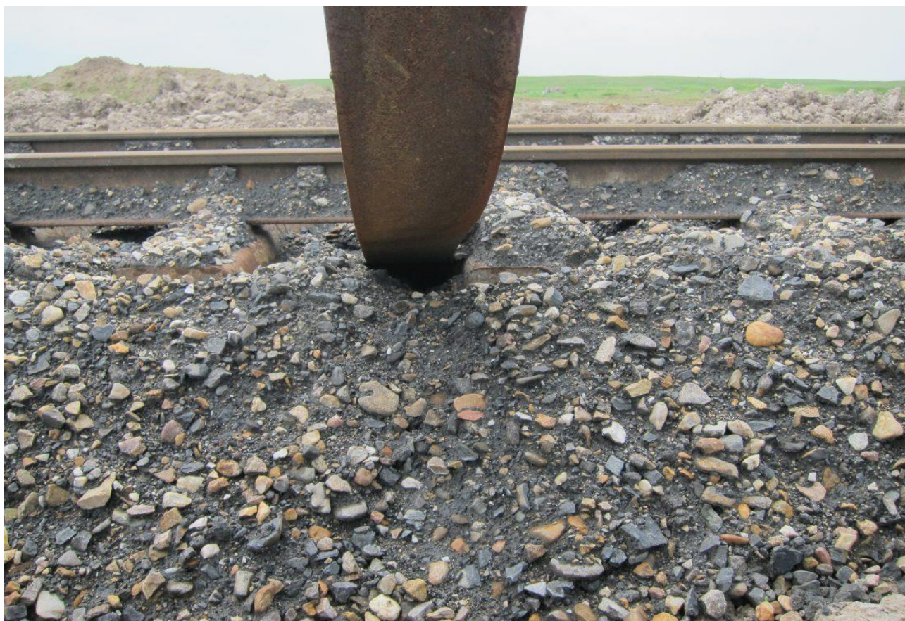
Hnízdo pod sloupkem troleje v kolejišti hnědouhelného lomu. Slatinická výsypka.