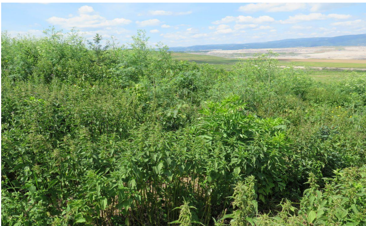
Nevhodná, velmi úživná, kopřivami a bezy zarostlá plocha. Lom Hrabák.