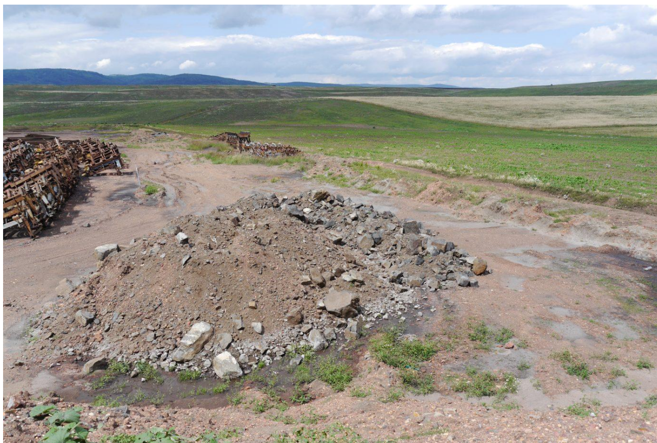
Hnízdo v hromadě kamení na okraji rekultivace (hnízdo v pravé horní části hromady). Lom Nástup.