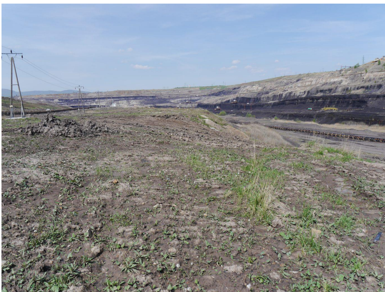
V ideálním případě je širší okolí upravované plochy bez keřové či stromové vegetace. Lom Hrabák.

Pokud máme možnost výběru z různých ploch, vybíráme pro zásah přednostně plochu, na kterou nenavazují plochy zarostlé keři či stromy, ale plochy, které jsou obklopeny holými půdami či bylinnými společenstvy.