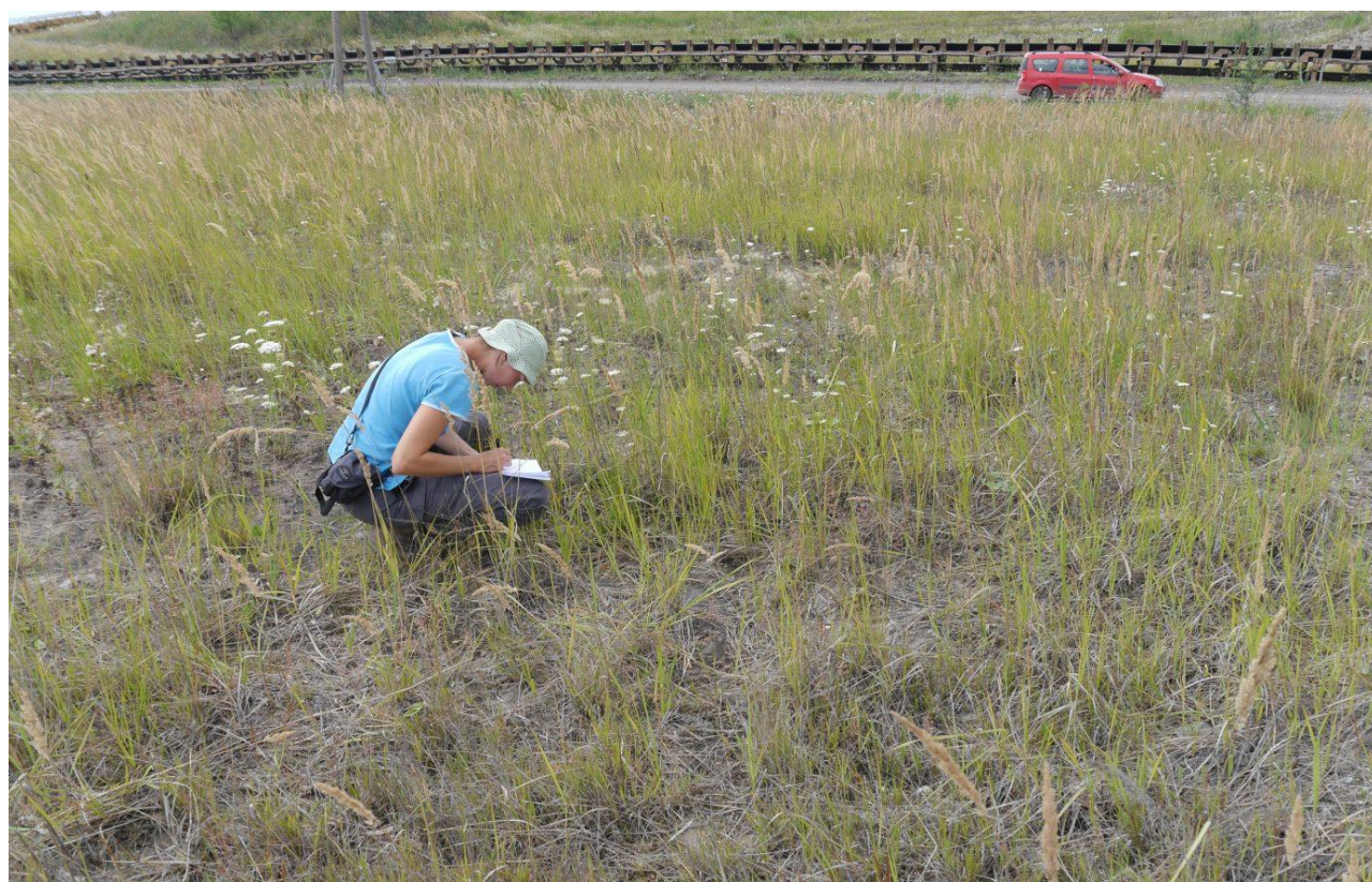
Ukázka plochy vhodné pro odstranění svrchní vrstvy půdy – málo úživná, ale třtinou již poměrně souvisle zarostlá plocha (cca 10 let po vytvoření). Lom Hrabák.