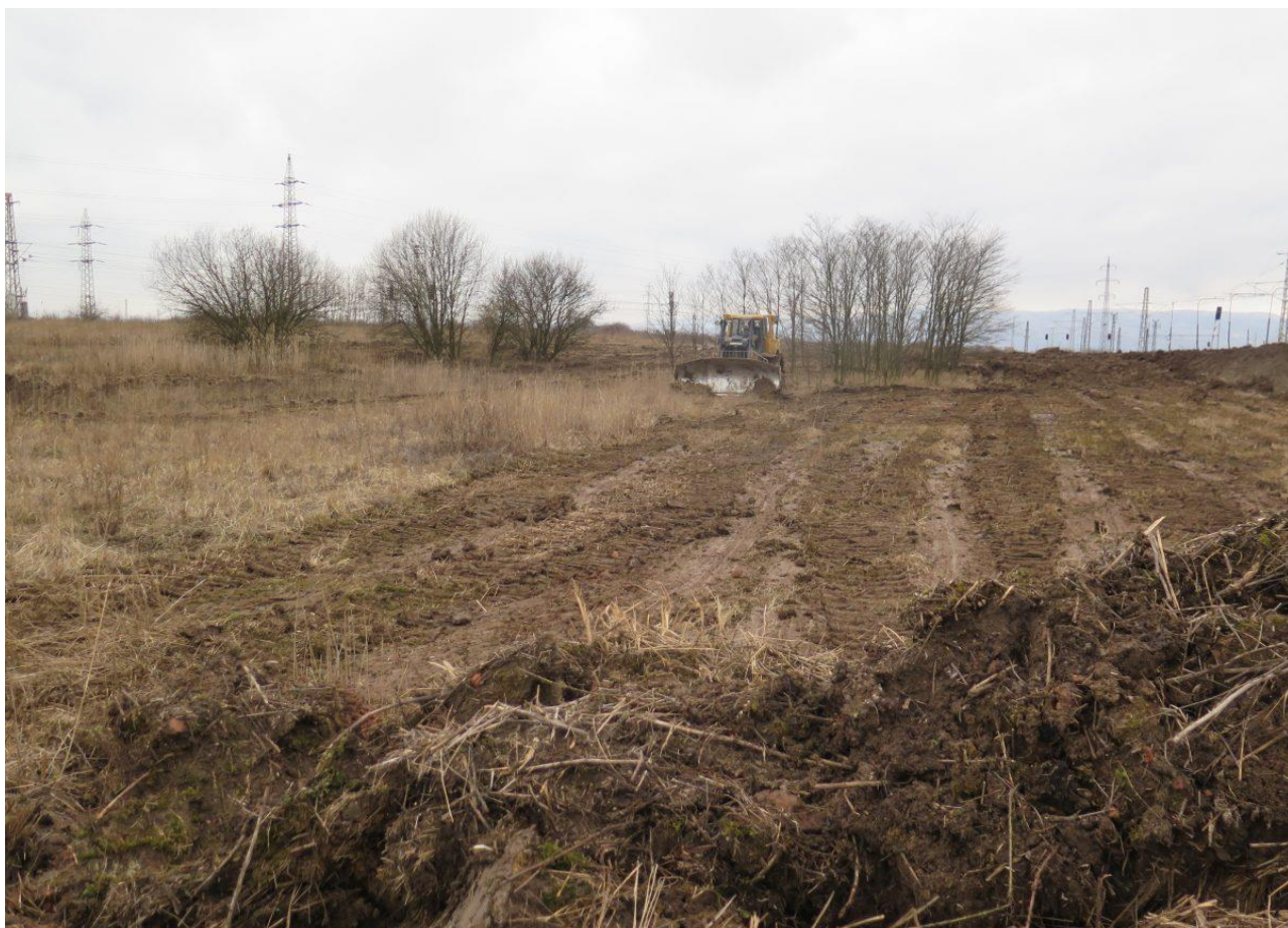
Odstranění pouze vrchní vrstvy půdy s vegetací je u málo úživných ploch dostatečný zásahem. Slatinická výsypka.

Pokud byla plocha vybrána správně (viz výběr vhodného území) a upravovaná plocha není příliš bohatá živinami, stačí pouze zásah na povrchu. U některých velmi vhodných ploch, kde po několika letech došlo k přílišnému zahuštění vegetace, stačí pouhý pojezd pásové techniky. Většinou jde ale pouze o doplňkové řešení např. na okrajích ploch, velmi vhodné je podél cest atd. (viz obrázek). V naprosté většině případů je nutné strhnout vegetaci i s vrchní vrstvou půdy. Na málo úživných půdách se jako ideální jeví stržení 5 – 10 cm půdy. Stržená vrstva, která je bohatší na organický materiál může být nahrnuta k okraji plochy, případně z ní mohou být na ploše nahrnuty nepravidelně velké hromady (viz níže). Větší množství skryté zeminy samozřejmě není na škodu, ale výrazně zvyšuje realizační náklady. Z hlediska podpoření populace bělořita šedého je účelnější provést opatření místo do větší hloubky na větší ploše.