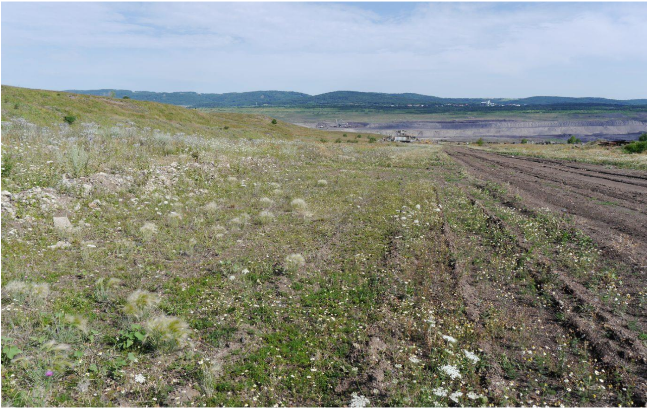
Pouhý pojezd pásové techniky na řídkce zarostlých plochách či podél cest výrazně zvyšuje atraktivitu území pro bělořita šedého. Lom Šverma.