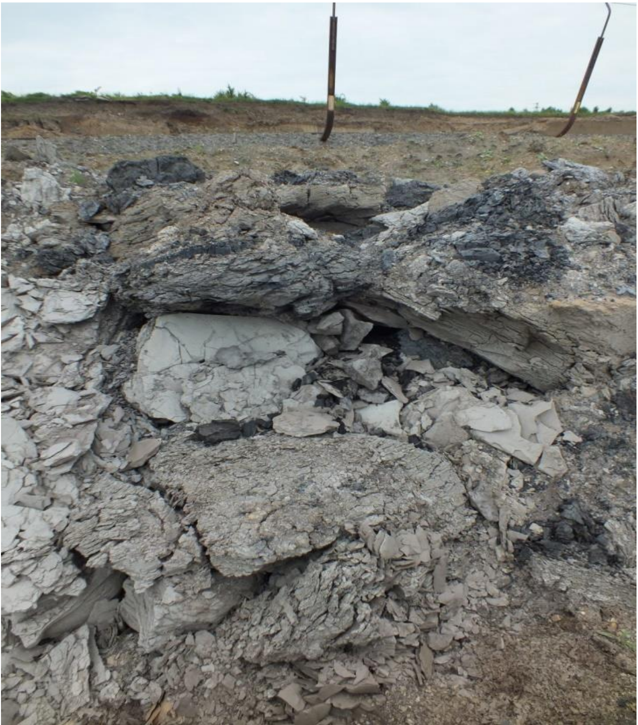
Hnízdo v hromadě jílových bloků. Lom Šverma.