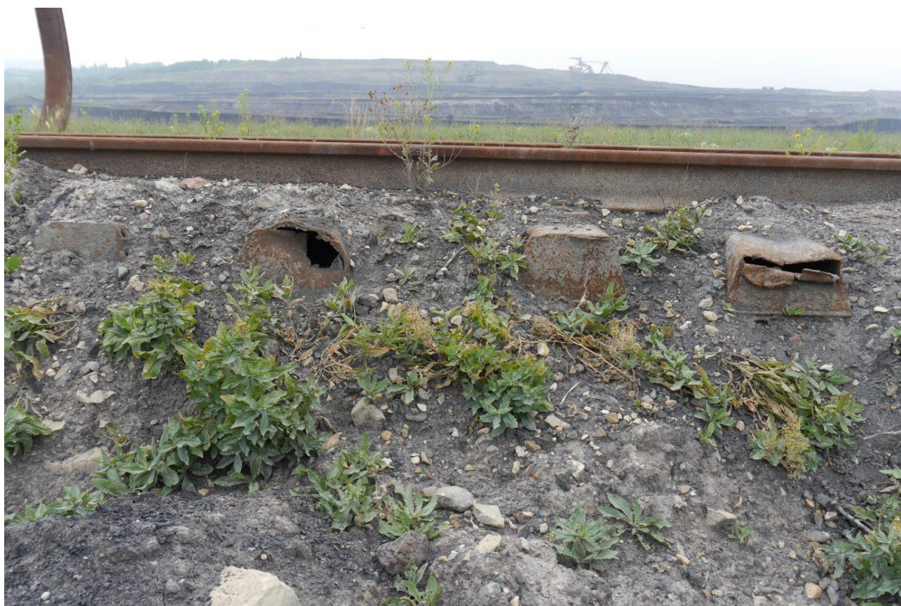
Hnízdo v poškozeném železném železničním pražci (otvor vlevo). Výsypka lomu Šverma.