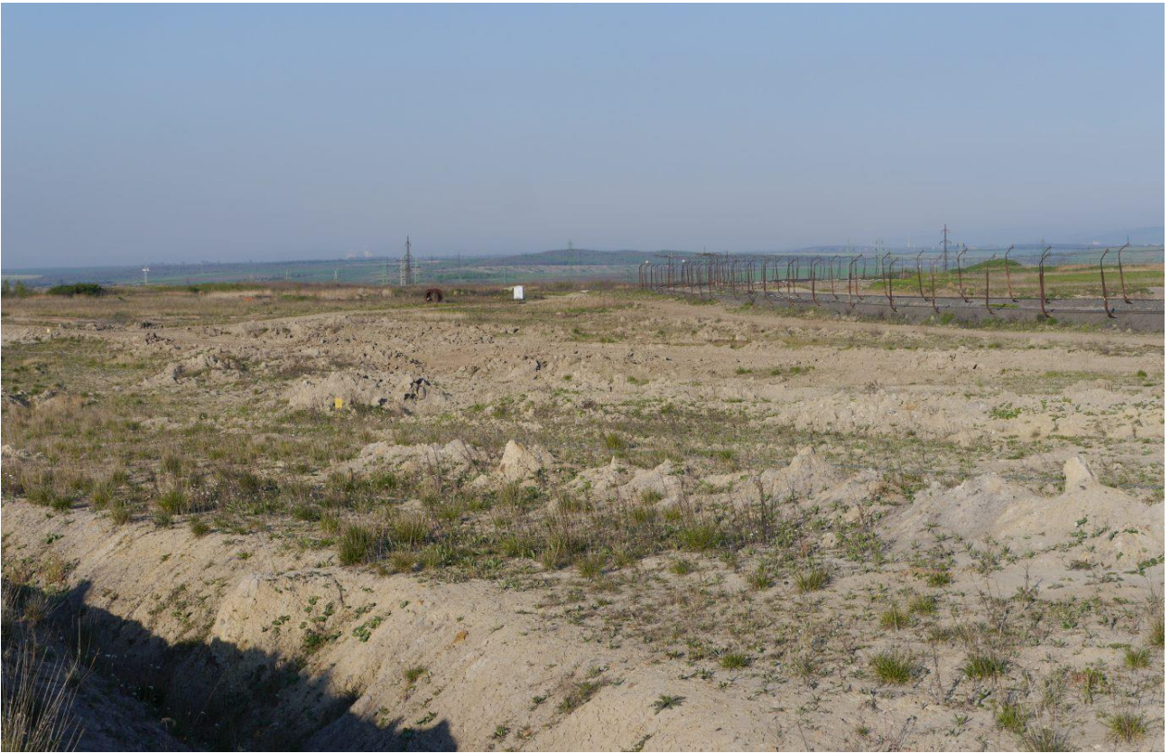
Optimální hnízdní biotop bělořita šedého s výraznou vertikální členitostí plochy po managementovém zásahu. Hnízdo bylo umístěno v železničních pražcích tratě na okraji fotografie. Slatinická výsypka.