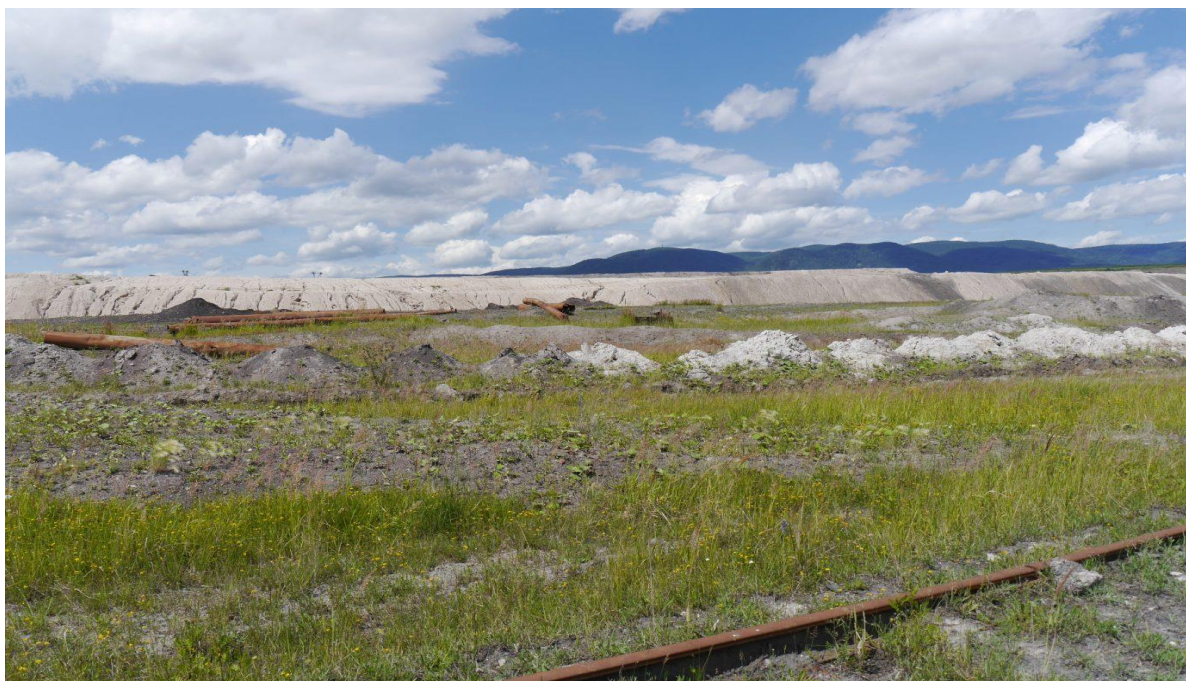
Optimální biotop pro bělořita šedého ve velkolomu Šverma.