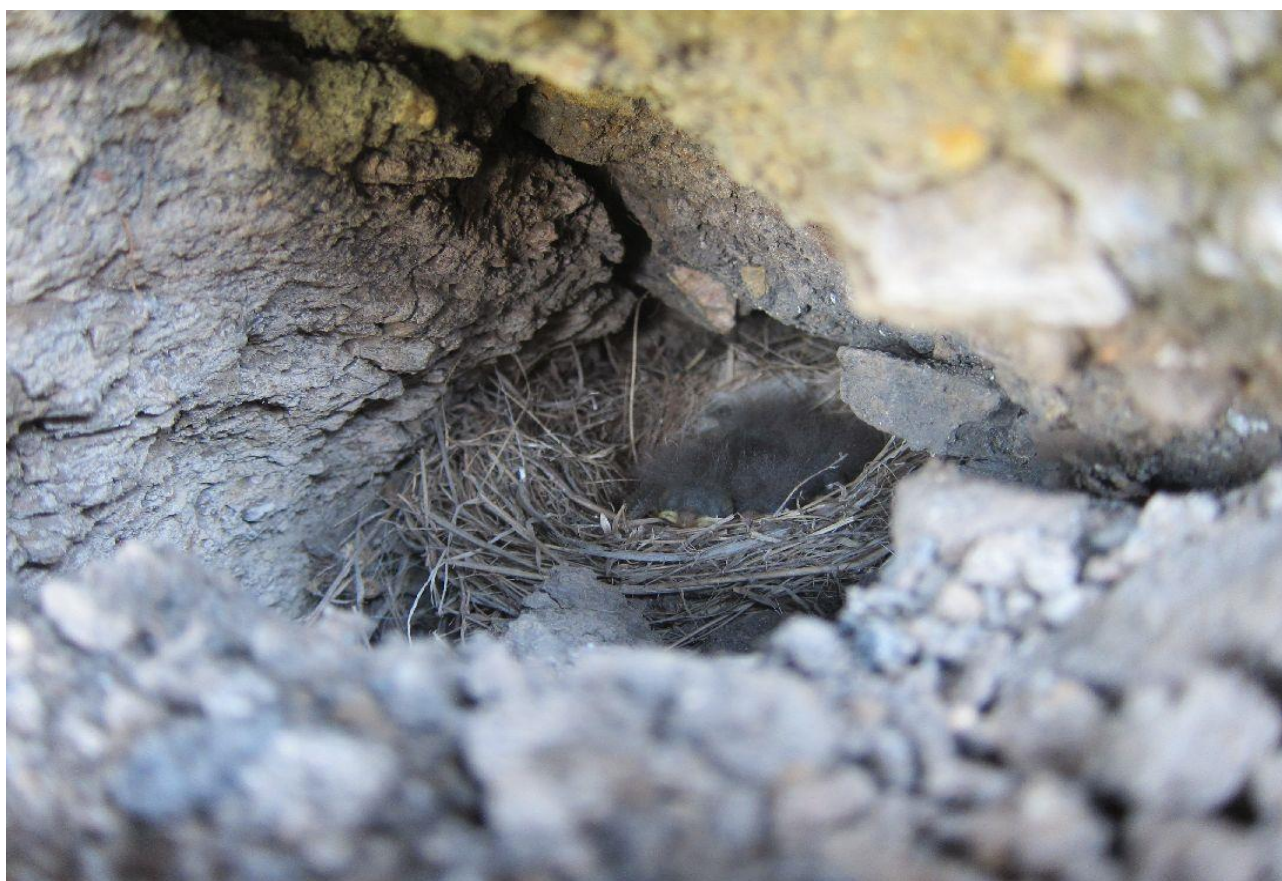
Hnízdo v puklině – širší situace viz obrázek výše. Lom Šverma.