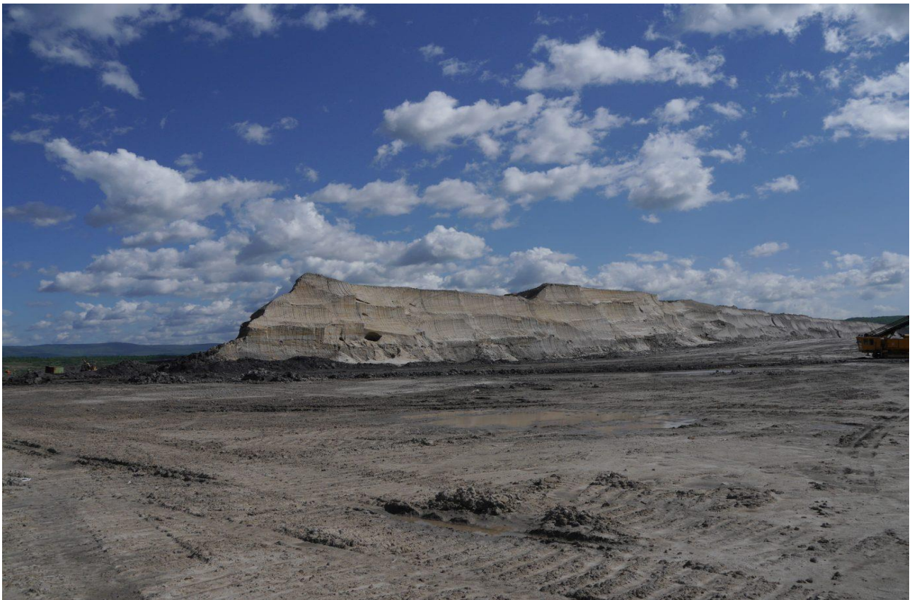
Bělořit šedý osidluje i extrémní, holé plochy z kterých zaletuje za potravou do širokého okolí. V tomto případě hnízdil pár přímo v lomové stěně v zadní části fotografie. Lom Šverma.