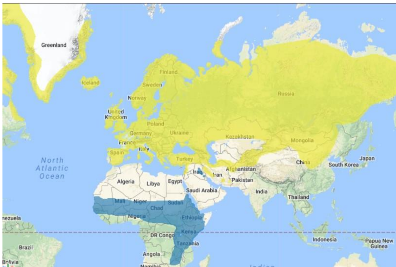
Mapa areálu rozšíření bělořita šedého. Žluté oblasti – areál hnízdního rozšíření, modré oblasti – zimoviště.

V druhé polovině dvacátého století došlo, s největší pravděpodobností vlivem rozsáhlých změn zemědělského hospodaření a tím i charakteru krajiny, k prudkému úbytku druhu především v intenzivně obhospodařovaných částech střední a západní Evropy. V letech 1970–2000 byl zaznamenán pokles ve většině zemí Evropy, který pokračuje i nadále. Výsledky z celoevropského monitoringu běžných druhů ptáků potvrzují pro bělořita šedého za období 1991–2006 klesající trend početnosti s průměrným dlouhodobým poklesem o 3 % ročně (PECBMS 2012). Nejsilnější relativní pokles nastal ve střední a západní Evropě (Velká Británie, Francie, Česká republika, Slovensko atd.) – BirdLife International (2017). Velikost populace v okolních zemích je v posledním červeném seznamu BirdLife International (2017a) odhadována následovně: Německo 4200 až 6500 párů, Polsko 49 000 až 71000 párů, Rakousko 15000 až 20000 párů a Slovensko 2000 až 4000 párů.