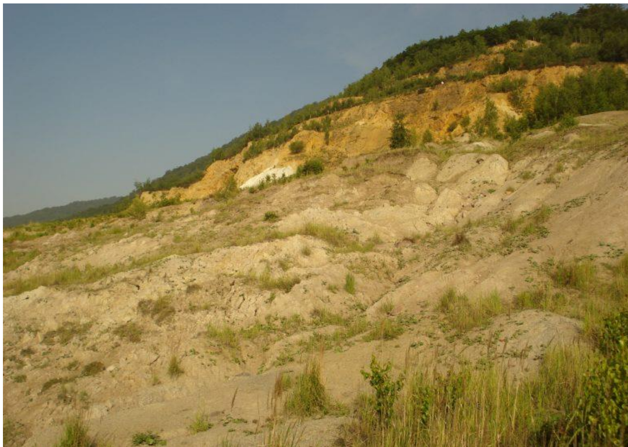
Ideální biotop bělořita šedého – řídkce zarostlé, vertikálně výrazně členité plochy. Lom ČSA.