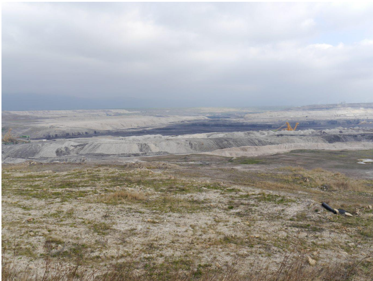
Rozlehlost hnědouhelných lomů je zárukou vhodného životního prostředí pro řadu ohrožených druhů. Lom Šverma a Hrabák.

Úbytkem či úplným vymizením biotopů trpí v současné době velké množství druhů. Realizace managementových opatření pro bělořita šedého pomáhá nejen tomuto druhu, může prospívat i jiným ohroženým druhům, např. rostlinám vázaným na iniciační sukcesní stadia nebo žahadlovým blanokřídlým. Bělořit šedý pak může být chápán jako příklad tzv. deštníkového druhu na lokalitách, kde žije i řada dalších cenných druhů (např. písčovní, kamenolomy či těžebny jílovitých materiálů), a která jsou často při ochraně přírody přehlížena.